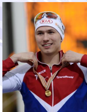
Павел Кулижников (ЧМ 2020 в беге на 500 м и 1000 м)