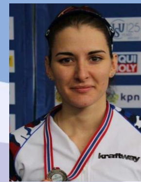
Ангелина Голикова (ЧМ 2021 в беге на 500 м)