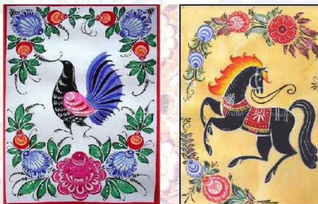
Цветочная роспись с включением мотива «конь» и «птица»